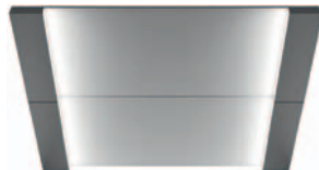
CL95 Epäsuora valo, sopii sairaaloihin potilaskäyttöön