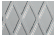
ST Kuvioitu teräs