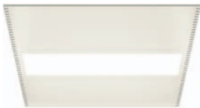
LF1 Tilalehdokas – vaatii 100 mm vähemmän ylätilaa