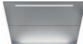
CL94 Vandaalihissin kattovalaistus kovaan käyttöön