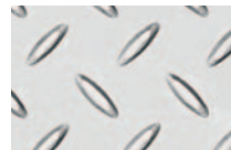
SS Ruostumaton teräs